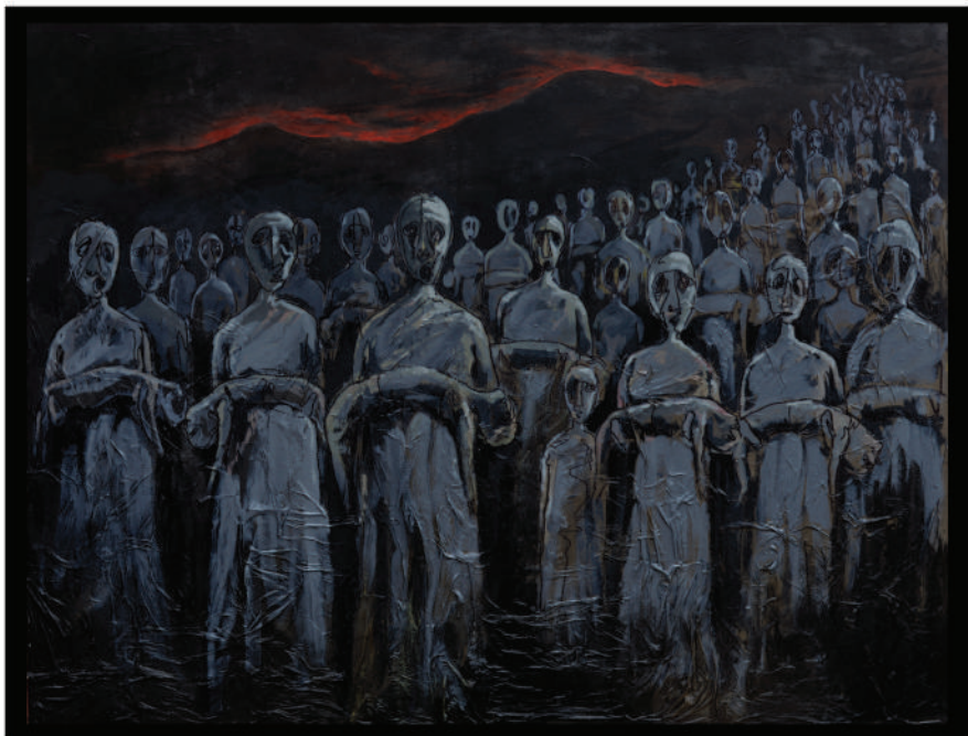
Mixed Media on canvas 130cmX170cm

میدیای جیاواز له سهر کانفاس ۱۷۰سم X ۱۳۰سم