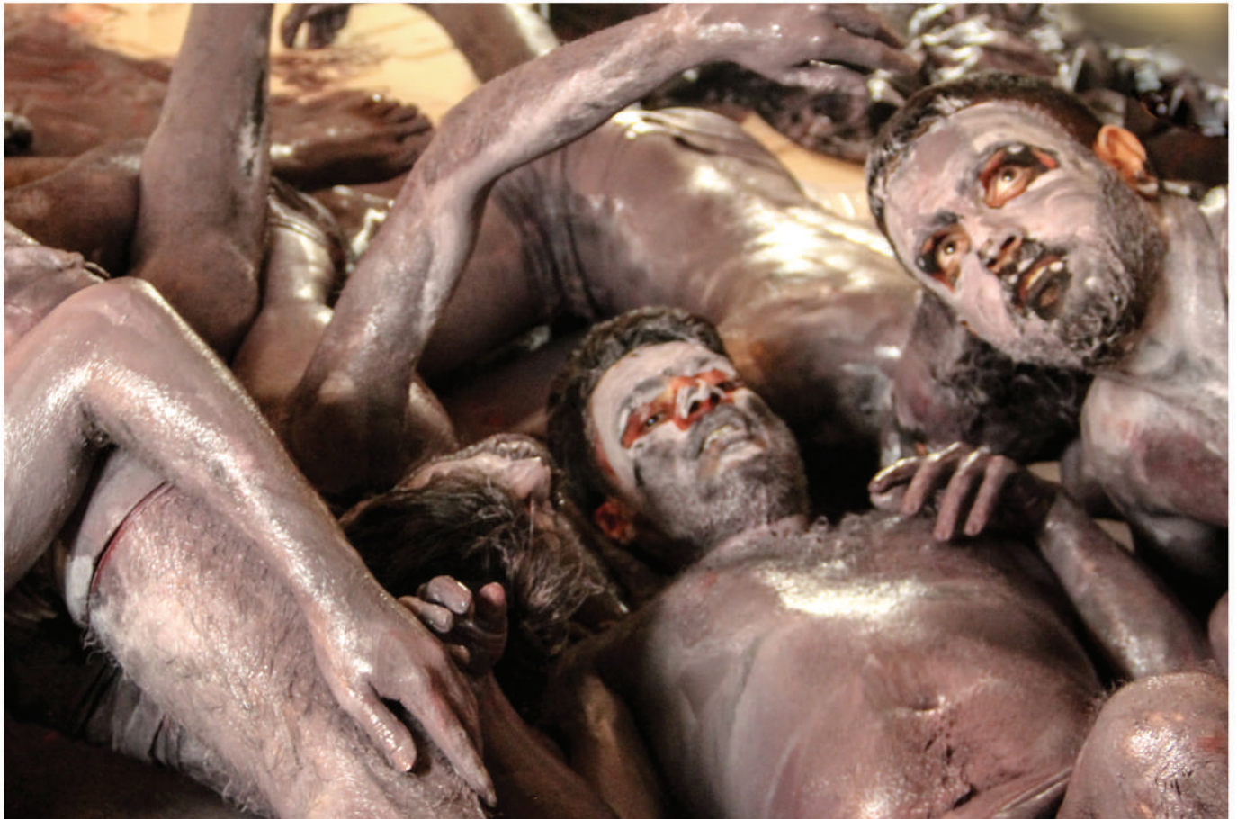
(Video Art) The Colours of War Duration: 00:04:52

کاری فیڊیوی پی رهنګه کانی جه نګ ماوه: ۰۰:۰۴:۵۲