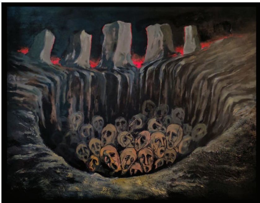
Mixed Media on canvas 130cmX170cm

میدیای جیاواز له سهر کانفاس ۱۷۰سم X ۱۳۰سم